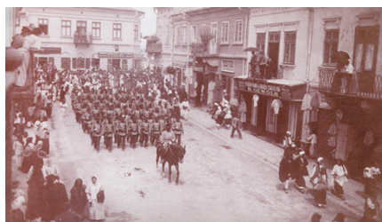
Siret în perioada interbelică