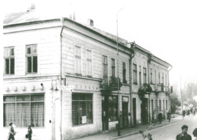
Siret în perioada interbelică